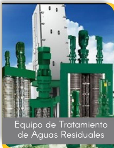
Equipo de Tratamiento de Aguas Residuales