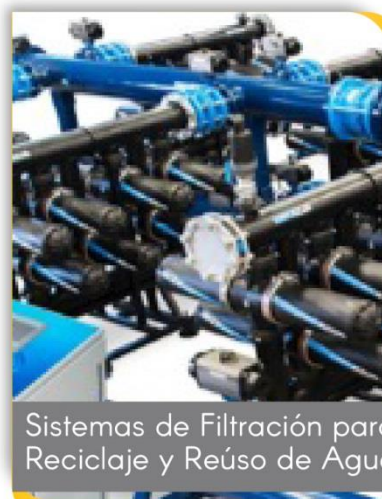
Sistemas de Filtración para Reciclaje y Reúso de Agua