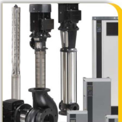
Equipo de Bombeo

Soluciones reales en su obra electromecánica e hidráulica, conozca los equipos que distribuimos.