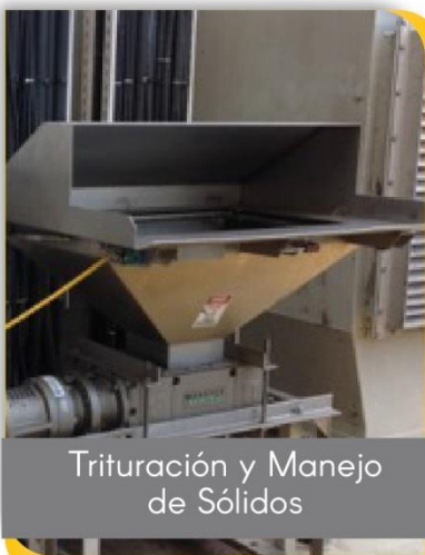
Trituración y Manejo de Sólidos

Soluciones reales en su obra electromecánica e hidráulica, conozca los equipos que distribuimos.